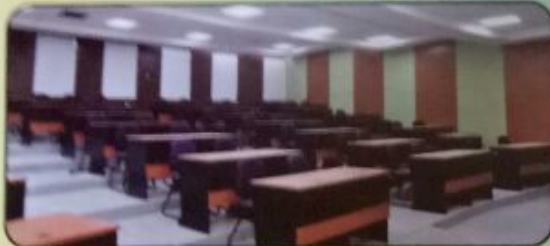
Class Room (100 Capacity)