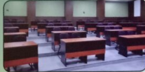
Class Room (50 Capacity)