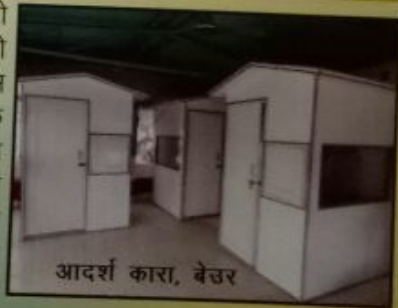
आदर्श कारा, बैतर

राज्य की काराओं में संसीमित बंदियों को उनके परिजनों, मित्रों एवं कानूनी सलाहकारों से दूरभाष के माध्यम से वार्ता कराने के उद्देश्य से राज्य की सभी काराओं में Telephone Booth के अधिष्ठापन हेतु भारत संचार निगम लि० को 9.11 करोड़ रुपये की लागत पर स्वीकृति दी गयी है। इस आलोक में BSNL द्वारा प्रत्येक केन्द्रीय कारा में 3 दूरभाष केन्द्र, प्रत्येक मंडल कारा में 2 दूरभाष केन्द्र तथा प्रत्येक उपकारा में 1 दूरभाष केन्द्र अधिष्ठापित किया जा रहा है। वर्तमान में 30 काराओं (5 केन्द्रीय काराओं, 16 मंडल काराओं तथा 9 उपकाराओं) में कुल 56 दूरभाष केन्द्र में अधिष्ठापन किया गया है, जिनका उद्घाटन माननीय मुख्यमंत्री के कर-कमलों द्वारा किया जा रहा है।